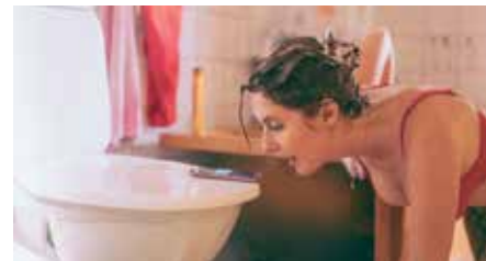
Filmen Ring mamma! (2019), manus, regi Lisa Aschan.

Brittiska skådespelare ska få bättre stöd vid sexscener och intima filminspelningar. Detta genom att medlemsorganisationen Directors UK nu lanserar en lista på 96 riktlinjer för filmbranschen i Storbritannien, ett slags guide för hur intima inspelningar ska genomföras utan kränkning. Bland annat föreslås det att inga repetitioner ska ske utan kläder, utan bara när inspelning äger rum. Såväl British Film Institute som British Academy Film Awards står bakom förslaget (källa: Sveriges Radio).