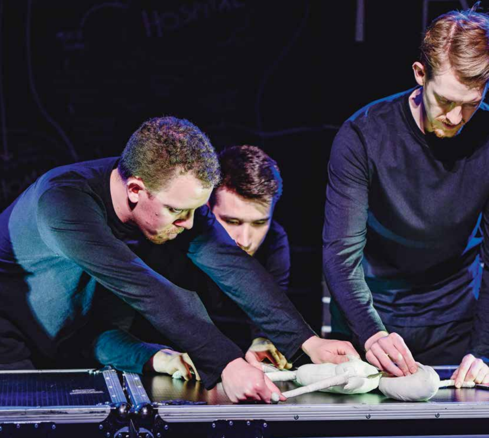
Föreställningen Meet Fred med den engelska gruppen Hijinx.

Bali i april är det tänkt att en festivalgrupp ska bildas så att festivalen i Västra Frölunda kan sätta mer fokus på den samtida dockteaterkonsten.