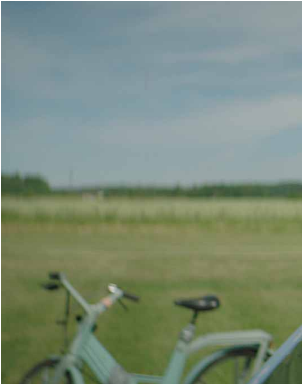
Bild ur Tårtgeneralen (2018) med Mikael Persbrandt som karaktären Hasse P. Regi: Filip Hammar och Fredrik Wikingsson.