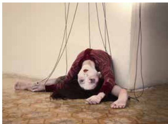
Regissören, scenografen och kostymören Alice Laloy fotografier visas på Frölunda Kulturhus fram till den 12 januari 2020.