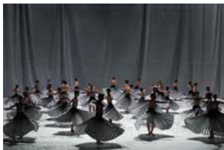
Alexander Ekman's Eskapist hade urpremiär med Kungliga Baletten 5 april 2019.