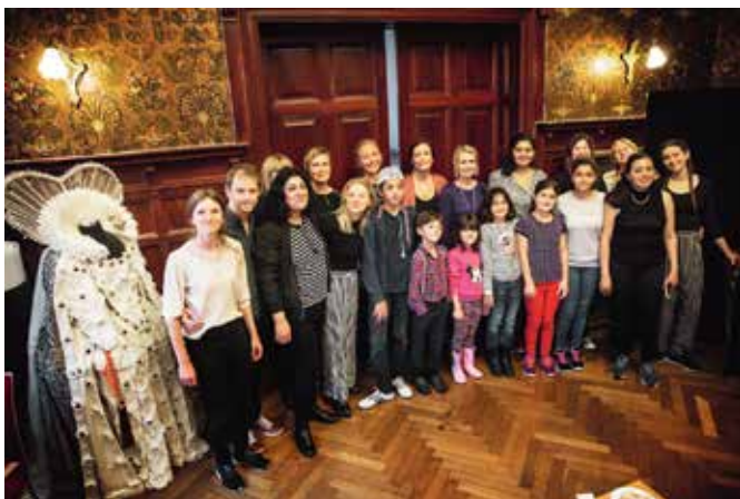
Efter premiären av En annan värld samlades ensemblen, alla barn och föräldrar.

– Barnen kom till premiären med sina föräldrar. Några blev lite rädda, men pjäsen slutar ändå bra. Först på premiären förstod barnen vad de hade gjort. De hade fått rita på en lång pappersrulle och alternerat sina platser så att de kunde fylla i varandras bilder. För mig var det viktigt att alla barn skulle kunna känna sig representerade i bilderna, och känna igen sig i animationerna. Föreställningen blev jättefin och gick väldigt bra. Det finns ett sug efter pjäsen, så vi tar upp den igen.