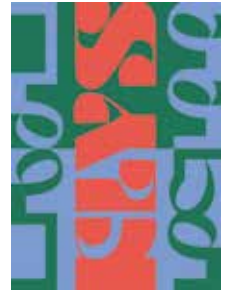
Jubileumsboken Klys 1959–2019 , beskriver organisationens roll för den svenska kulturpolitiken. Kan beställas via Klys kansli.