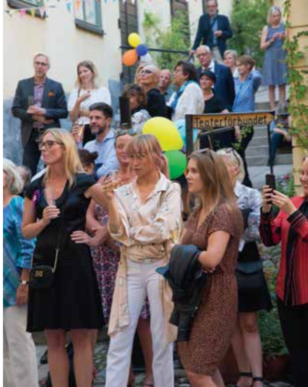
medan gästerna lyssnar och minglar runt på gården.