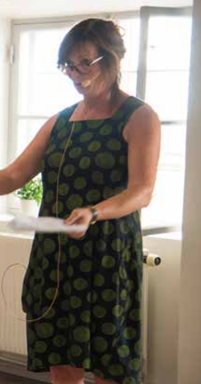
strand talar om kulturpolitiken och scenen.