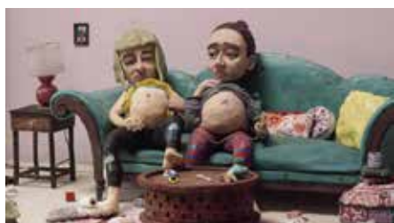
Joanna Rytels Moms on fire finns i Filmforms samlingar.

Nu går det att söka på Stockholms konstnärliga högskolas fristående kurser för våren 2020. I utbudet finns bland annat "Att desorientera vithet och heterosexualitet". För dig som arbetar med scenkonst och vill utforska och arbeta med "queera och dekoloniserande verktyg i ditt konstnärliga arbete". Några andra kurser är avancerad rollgestaltning, dans för barn och unga samt "cirkusdidaktik – kulturskolelivet". Ansökningsperioden är öppen till och med den 15 oktober. Läs om alla kurser på: www.uniarts.se