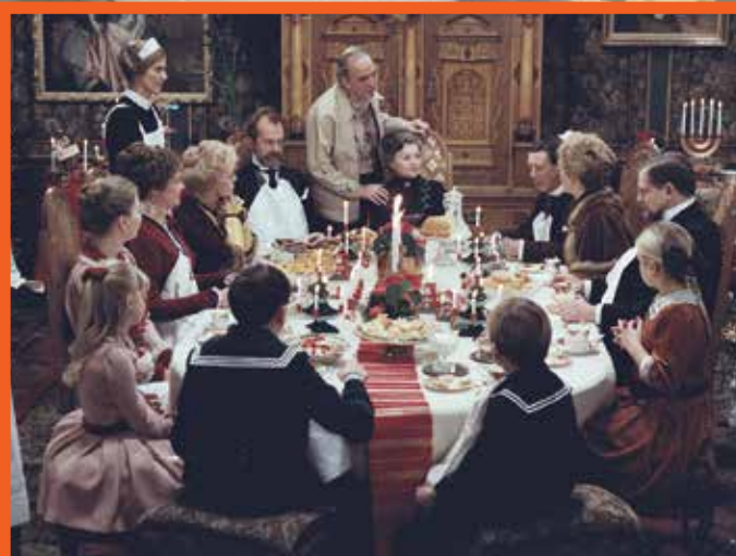
Fanny och Alexander (1982)