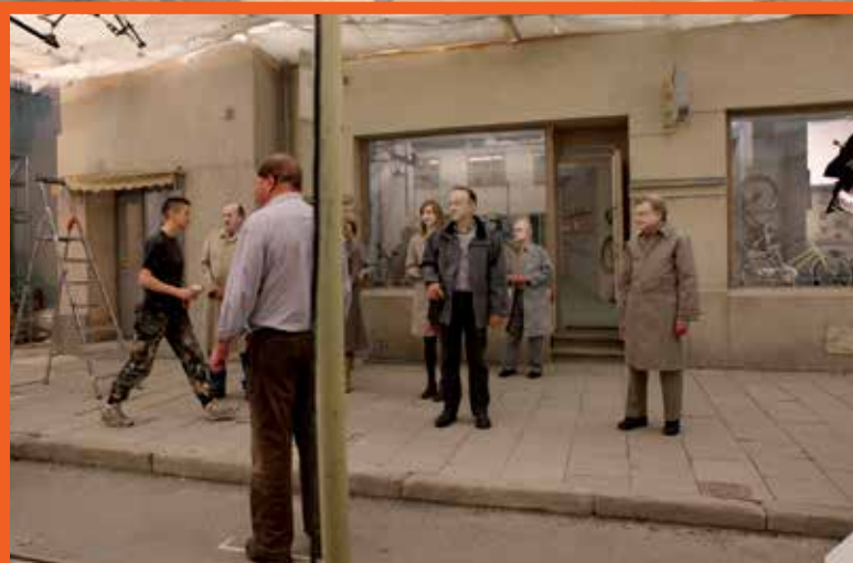
En duva satt på en gren och funderade på tillvaron (2014)