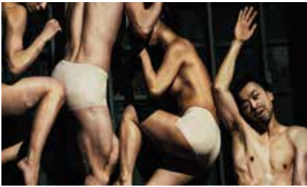
Ur Sasha Waltz Körper på Kungliga Operan i våras.