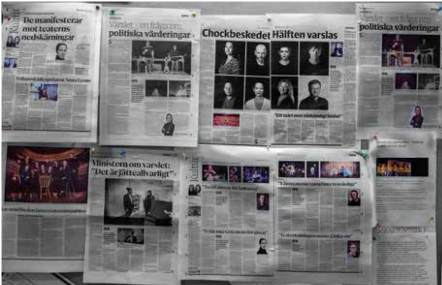
Anslagstavlan är fylld med klipp från Nerikes Allehanda, tidningen har haft över 30 artiklar om varslet.