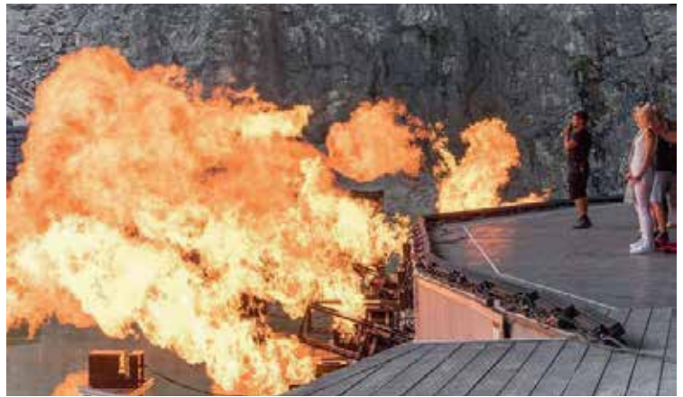
Eld på scen i Dalhalla: det var som att stå mitt i en majbrasa.